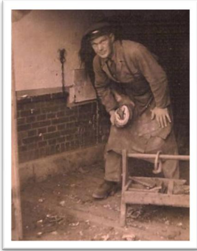
Min far, den store smed